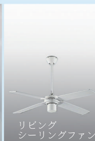
リビング シーリングファン