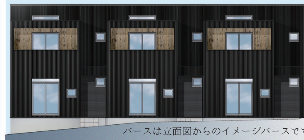
パースは立面図からのイメージパースです。