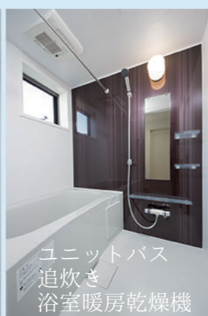
ユニットバス 追炊き 浴室暖房乾燥機