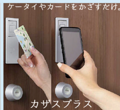
ケータイやカードをかざすだけ。