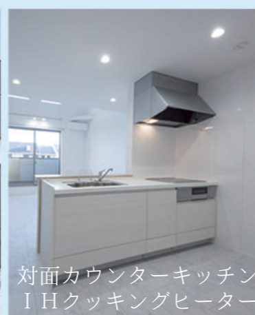
対面カウンターキッチン IHクッキングヒーター