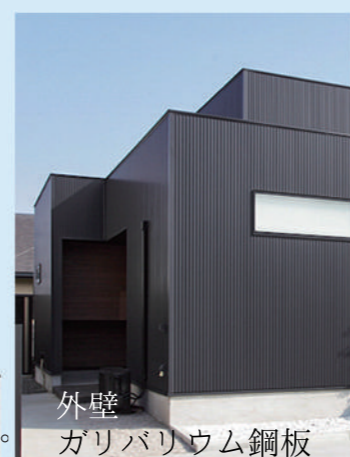
外壁 ガリバリウム鋼板