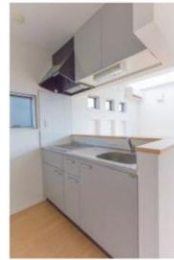
対面式カウンターキッチン