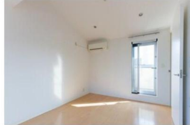
3F 洋室、ロフト、ワークインクローゼット