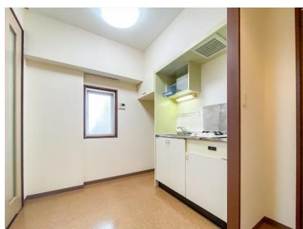
キッチンスペース