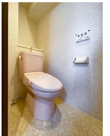
トイレ(温水洗浄便座)