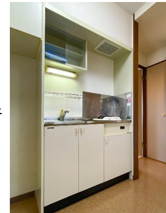
システムキッチン(ガス1口) ユニットバス(浴室乾燥機)