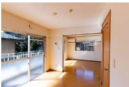
リビングダイニングキッチン

※ 図面と現況が異なる場合は現況を優先させていただきます。 ※ 掲載している画像は前回募集時に撮影