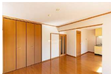
リビングダイニングキッチン