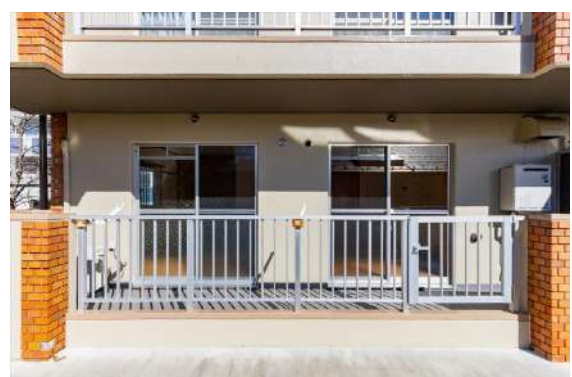
バルコニー側 2面の窓から採光

※ 図面と現況が異なる場合は現況を優先させていただきます。 ※ 掲載している画像は前回募集時に撮影