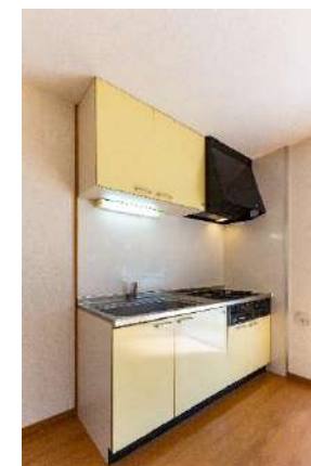
システムキッチン(ガス3口) ユニットバス Z(追炊き)

※敷地内駐車場あり 月額 12,000円(税抜) 敷金 1ヶ月 更新料 1ヶ月 ※角部屋 ひな壇につき 陽当たり・陽光さんさん