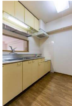
キッチン(コンロ持込)